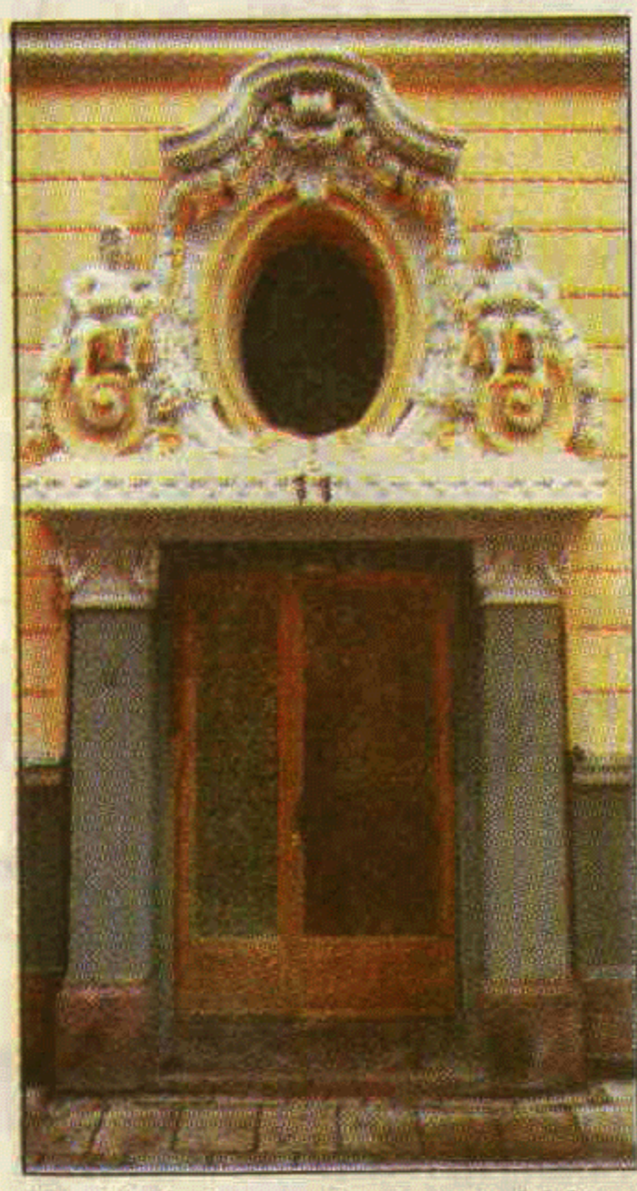
Fastighetens skrytportal hittar man mot Skvadronsgatan, på nr 11.