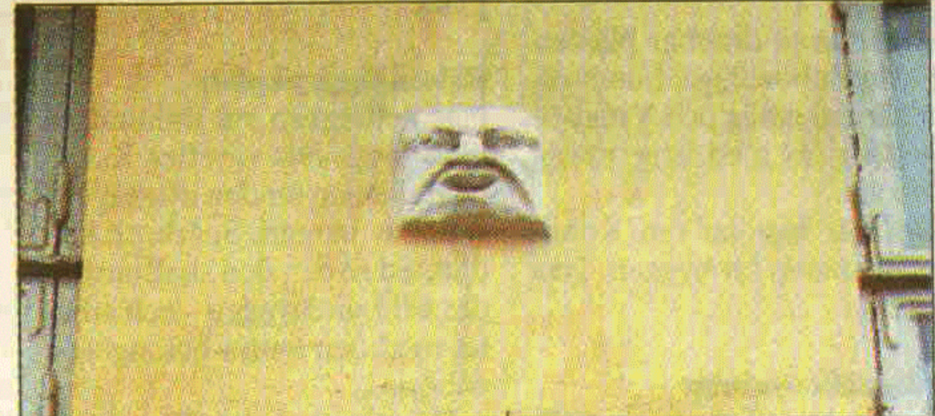
Det finns små huvuden under burspråken, ansiktena ser nästan medeltida ut.