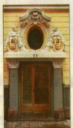
Fastighetens skrytportal hittar man mot Skvadrons-gatan, på nr 11.

Disparata Här vid Regementsgatan är stildragen lite mer disparata. Med tanke på arkitektens förnamn skulle man vilja tala om oscariansk pompa och ståt, men här finns drag av både nyklassicism, gustaviansk stil och jugend. Men dessutom förekommer det små ansikten under burspråken. Dessa maskaroner påminner om de huvuden som man kan hitta på medeltida hus i Provençe. Fast maskaroner förekom också under renässansen. Och regalskeppet Vasa var rikt utrustat med dylika figurer. Portalen på Skvadrons-gatan