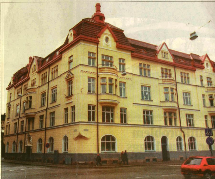
Visat är Regementsgatan - Skvadrons-gatan en pampig hörna.